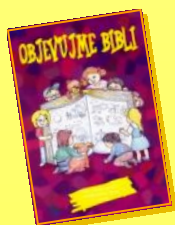
cyklus na 4 roky pro práci s věkem 3-6 let

Nechávej děti biblické poselství prožívat všemi smysly!