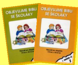
cyklus na 5 let pro práci s věkem 7-11 let